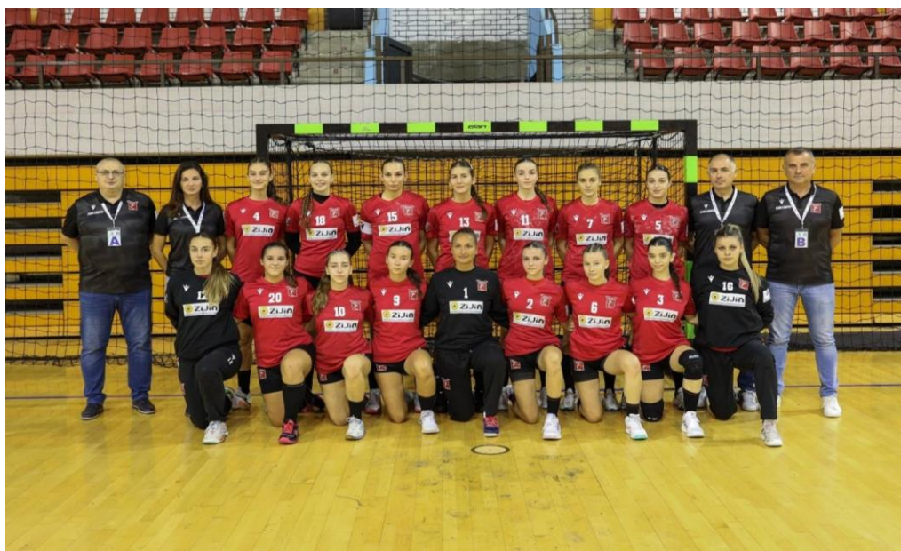
ЖОРК БОР Zijin Copper