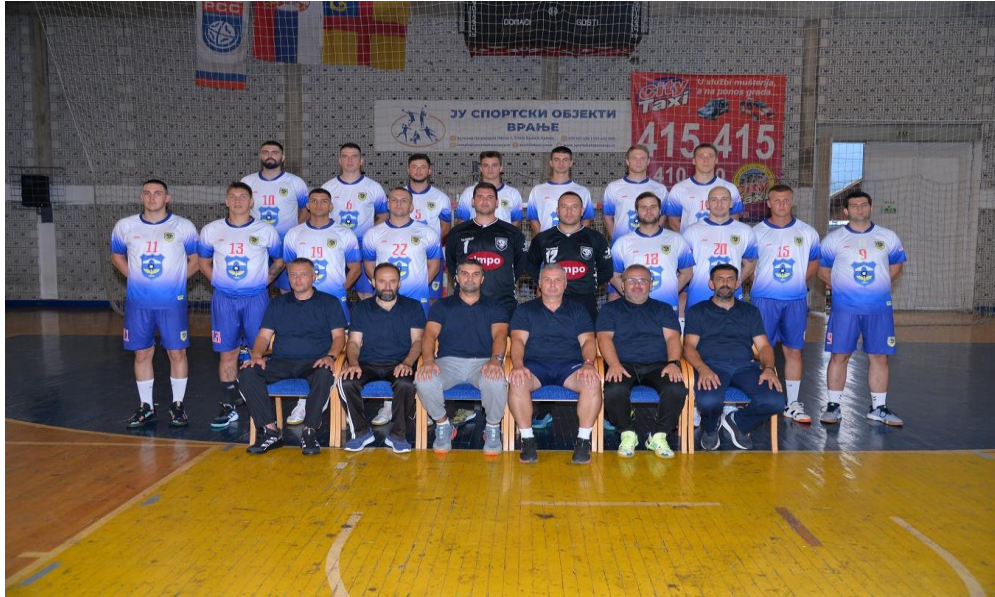
РК ВРАЊЕ 1957